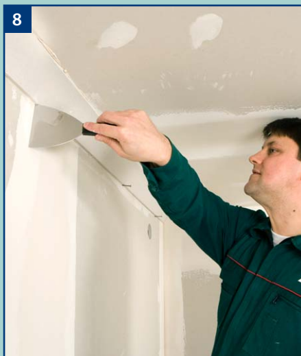
8 Nadmiar wypływającego kleju usuwamy szpachelką.