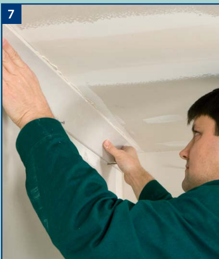
7 Przykładamy gzyms z klejem opierając go na wytaczających poziom gwoździach.