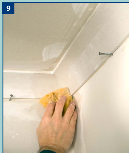
9 Wilgotną gąbką przecieramy górne i dolne krawędzie gzymsu aby usunąć wszelkie pozostałości kleju.