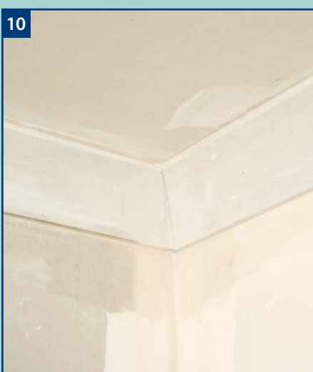
10 Po wyschnięciu kleju wyciągamy gwoździe podtrzymujące gzymsy.