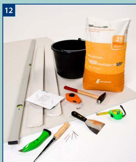
12 Gwarantujemy uzyskanie wysokiej jakości wykończenia przy zastosowaniu elementów systemu NIDA.