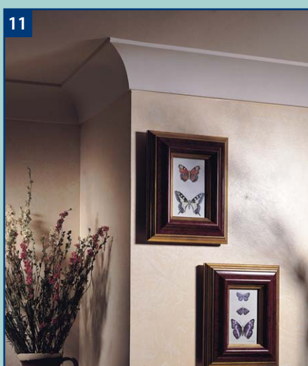
11 Naroża wykończone za pomocą gzymsów zwiększają estetykę pomieszczenia.