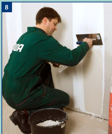
8 Następnie na spoinę nakładamy ostateczną warstwę gipsu NIDA Finisz za pomocą pacy.