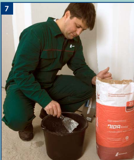
7 Kolejnym etapem jest przygotowanie gipsu szpachlowego NIDA Finisz.