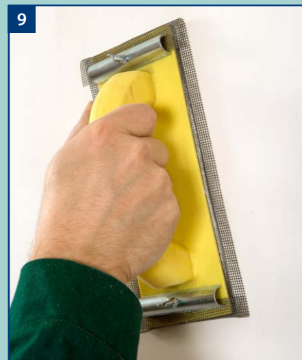
9 Wyschniętą spoinę wygładzamy zacieraczką z papierem siateczkowym.