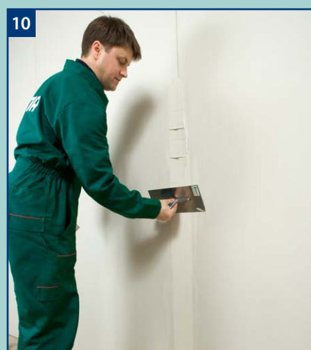
10 Do spoinowania połączeń pomiędzy płytami gipsowymi można stosować również gips szpachlowy NIDA Planfix Fresh. Gips ten nie wymaga użycia taśmy zbrojącej.