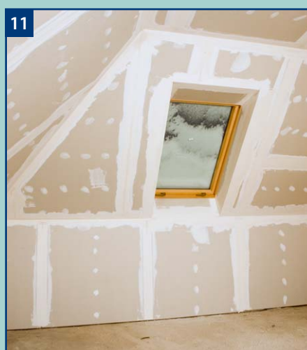
11 Po zaspoinowaniu wszystkich połączeń powierzchnia płyt jest przygotowana do ostatecznego wykończenia; jak malowanie, tapetowanie, nakładanie tynków japońskich.