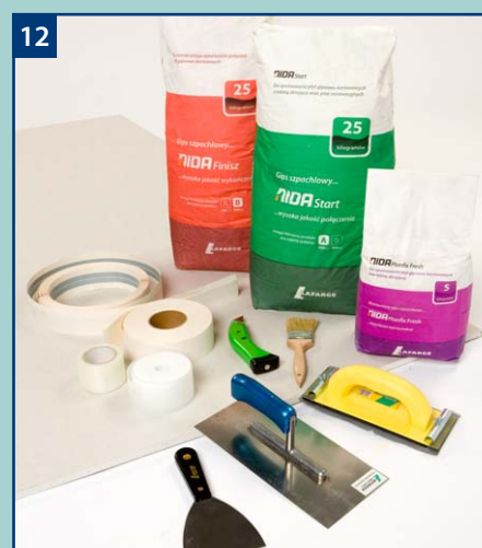
12 Gwarantujemy uzyskanie wysokiej jakości wykończenia przy zastosowaniu elementów systemu NIDA.